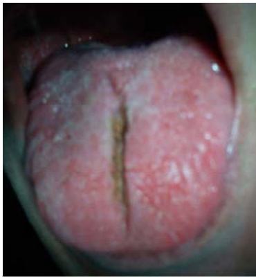
Նկար 97. Ծայրավոր լեզու:

Կլինիկան՝ բազմաթիվ ակոսներ, ծալքեր, ճաքեր լեզվի մեջքի և կողմնային հատվածներում, զուգահեռ լեզվի երկայնակի միջին գծին (նկ. 97):