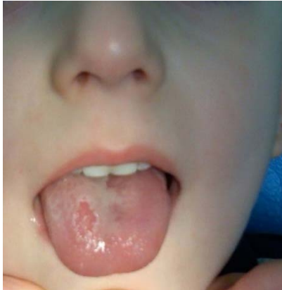
Նկար 96. Աշխարհագրական լեզու:

Կլինիկան. առաջանում են 0,5ամ գորշ բծեր, հետո՝ կարմրավուն, մեկը մյուսից սահմանափակված դեղնագորշավուն գլանակով՝ կազմված հաստացած թելանման պտկիկներից (նկ. 96):