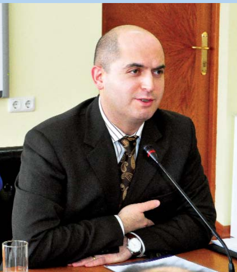
Արմեն Աշոտյան ՀՀ կրթության և գիտության նախարար

Եթե խոսենք թվերի լեզվով, ապա պետք է մի քանի ակնառու հաջողություններ կարևորենք: